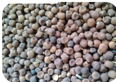
Vicia narbonensis , L., var Faïza : Gousses et graines