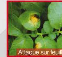
Attaque sur feuille