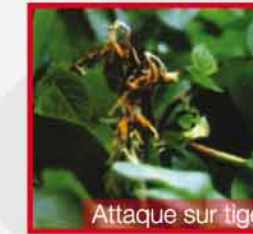
Attaque sur tige